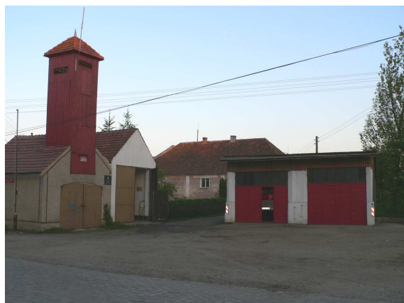
stan remizy obecnie