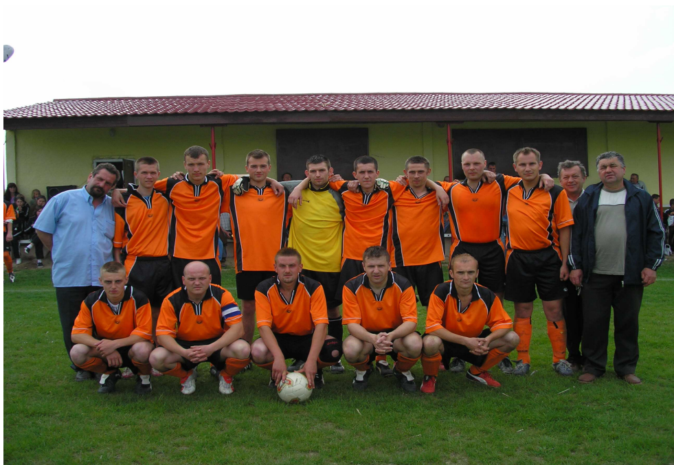
Skład drużyny Rodło, 2006.