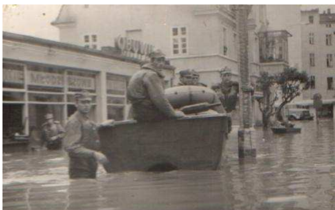
Strażacy z OSP Granowice brali czynny udział w akcji ratunkowej w Legnicy dotkniętej powodzią. Powódź w Legnicy ul. Jaworzyńska.

W czerwcu 1997 r. Jednostka OSP z Granowic brała udział w przygotowywaniu trasy przejazdowej przed przybyciem Ojca Świętego Jana Pawła II do Legnicy, a w lipcu 1997r. województwo legnickie nawiedziła powódź, wylały dwie niecki wodne – dorzecza Odry i dorzecza Kaczawy. W tych trudnych dniach grozy dowód obywatelskiej postawy dały formacje pożarników