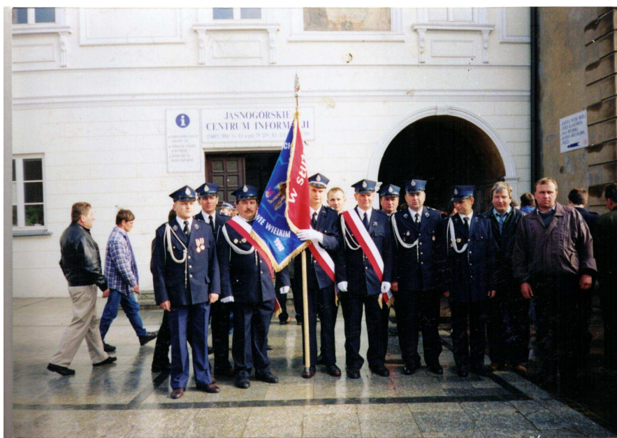
Wspólne zdjęcie członków OSP Budziszów i OSP Granowice przed wejściem do kaplicy.

15 maj 1999 r. w Sanktuarium Jasnogórskim NMP w 60 rocznicę ślubów strażackich z 1939 r. pożarnictwo polskie (w tym delegacja z Gminy Wądroże Wielkie) zgromadzone na błoniach jasnogórskich złożyło w Cudownej Kaplicy Matki Bożej VOTUM - dar serc strażackich jako wyraz hołdu , czci i wdzięczności dla Najświętszej Bogurodzicy - Maryi za dotychczasową opiekę, ślubując wszystkie swoje siły oddać w ratowaniu bliźnich, w imię Chrystusowych zasad miłości a swoją pracą i służbą przyczynić się do umacniania Ojczyzny naszej.